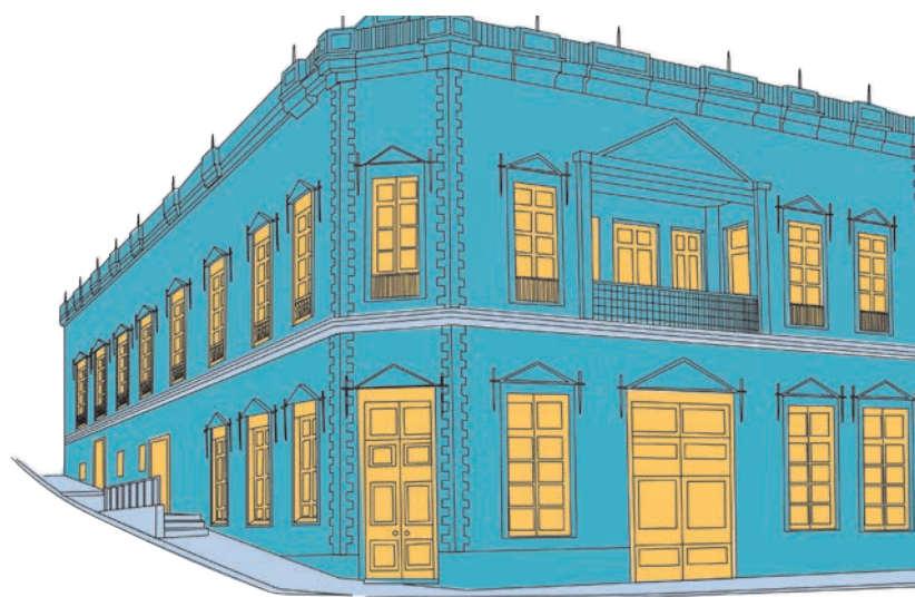
BARRIO INGLÉS, COQUIMBO

Los integrantes de la Mesa se comprometen a mantener confidencialidad (no divulgar) respecto del trabajo efectuado en cada sesión, con el objeto superior de resguardar el éxito de la propuesta final.