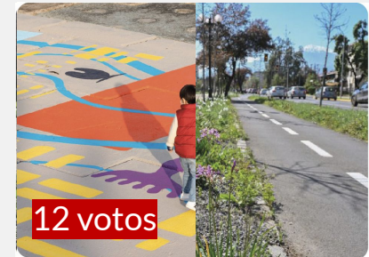
PAVIMENTOS QUE INCORPORAN DISEÑOS LÚDICOS Y JARDINES SUSTENTABLES