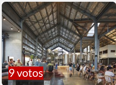
TIPOLOGÍA DE EDIFICIOS DEL TIPO GALPÓN

* PATIO CENTRAL Y EDIFICIO DE DOS PISOS CON VOTOS SIMILARES