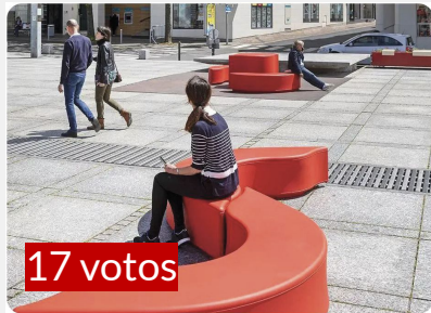
BANCAS LINEALES PARA LAS ÁREAS DE DESCANSO