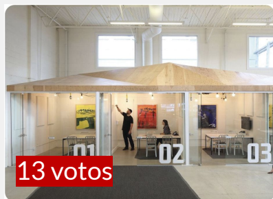
ESPACIOS PRODUCTIVOS COMO TALLERES INDIVIDUALES AGRUPADOS

* PATIO CENTRAL Y EDIFICIO DE DOS PISOS CON VOTOS SIMILARES