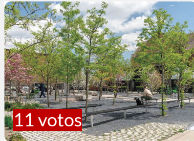
SISTEMA DE SOMBRAS MEDIANTE ARBOLADO URBANO