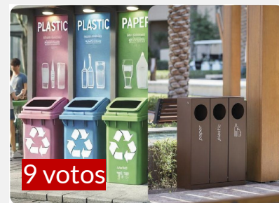
PUNTOS DE RECICLAJE EXTERIORES E INTEGRADOS AL ESPACIO PÚBLICO