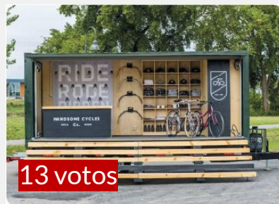
ESTRUCTURAS DE VENTA Y EXHIBICIÓN MEDIANTE TIENDAS MÓVILES