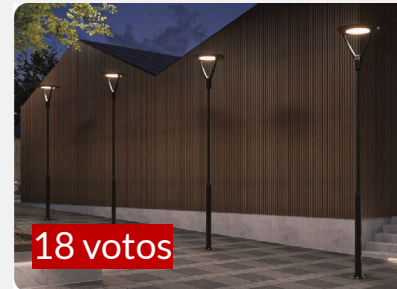
LUMINARIA COMO ELEMENTO DE CUIDADO DEL ESPACIO